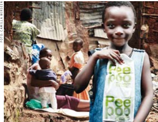
LIVRÄDDARE. 90 procent som dör i diarrésjukdomar är barn. Peepoo minskar spridningen av sjukdomar.

Den svenska engångstoaletten Peepoo ger näringsrikt gödsel på två veckor och kan lösa toalettbristen i tredje världen. Nu har tillverkning och försäljning i liten skala startat i Kenya.